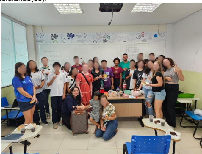
Figura 8 - Imagem tirada com todos os presentes reunidos, ao final do minicurso, a saber: alunas(os) do IF, supervisora e pibidianas(os).