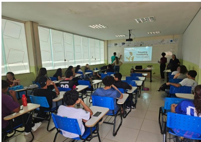
Figura 6 - Pibidianas(os) do IF Goiano, realizando o minicurso