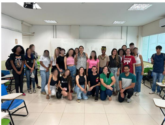
Figura 3 - Imagem tirada com todos os presentes reunidos, ao final do minicurso, a saber: alunas(os) do IF, supervisora e pibidianas(os).