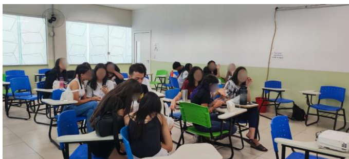
Figura 2 - Imagem das(os) alunas(os) do IF, sentados em grupos, realizando as atividades propostas no minicurso.