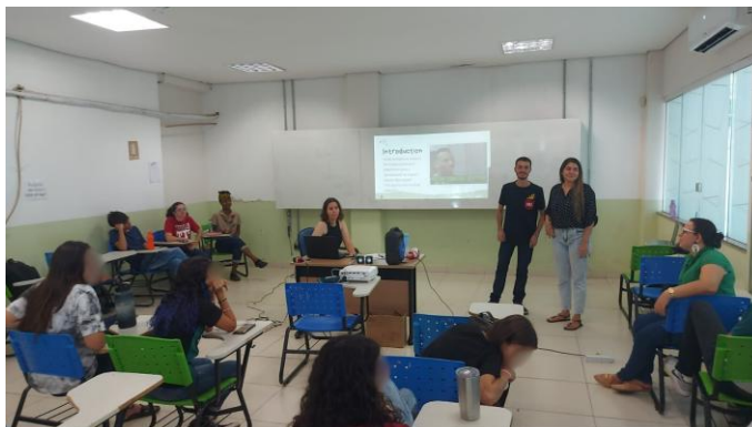
Figura 1 - Imagem no IF Goiano, realizando o minicurso