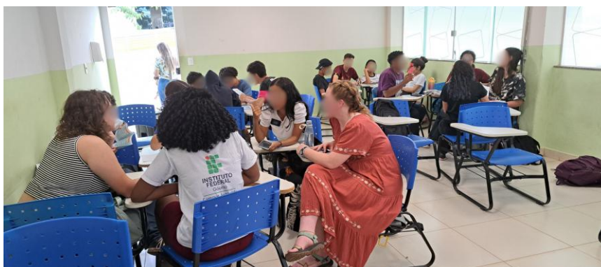
Figura 7 - Imagem das(os) alunas(os) do IF, sentados em grupos, realizando as atividades propostas no minicurso.