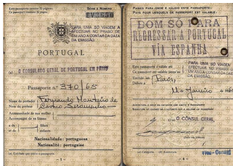
Último passaporte de Castro Soromenho 209

passaporte válido somente para retornar a Portugal via Espanha, com validade de um ano apenas. Os exilados eram prisioneiros do governo português em território francês. A solução ventilada por Soromenho foi a de conseguir um visto na embaixada brasileira.