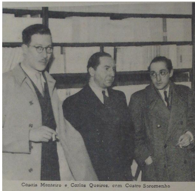
Fotografia publicada na revista Vida Mundial Ilustrada de Lisboa em 4 de dezembro de 1941.

Como se nota, é uma cobrança de um pai austero a exigir que o filho reconheça sua vinculação a uma tradição. Do lado português almejava-se construir uma integração luso-afro-asiático-brasileira. E, como é recorrente no pensamento luso, trata-se de um projeto presente no campo das idealizações.